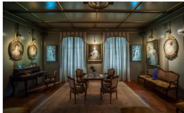
... und während der Show