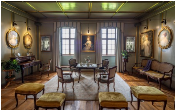
Der Salon vor ...